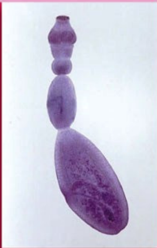
روابط عمومی اداره کل دامپزشکی استان البرز